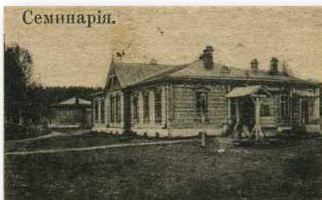
Киржачская учительская семинария

Из книги И.Ф. Токмаков «Историко- статистическое описание города Киржача- 1884г.